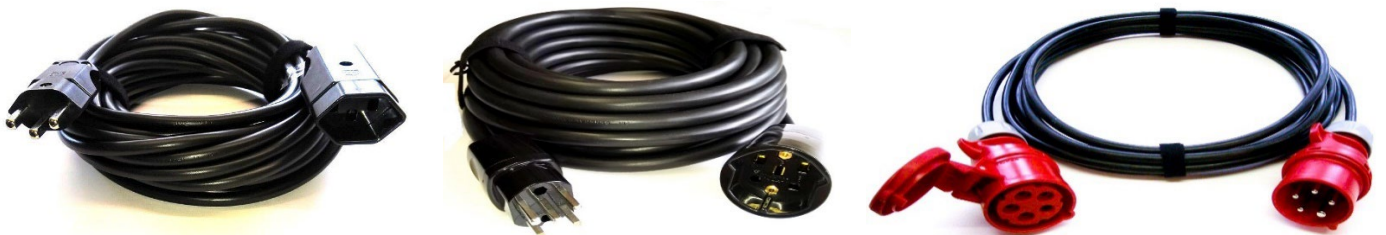
T23/16A/230V 3x2,5mm2 Typ 222sz T25/16A/400V 5x2,5mm2 Typ 444sz CEE16-5/400V 5x1,5mm2 oder 5x2,5mm2 Typ 666-1 = 5x1,5mm2 – 8kW Typ 666-2 = 5x2,5mm2 – 11kW