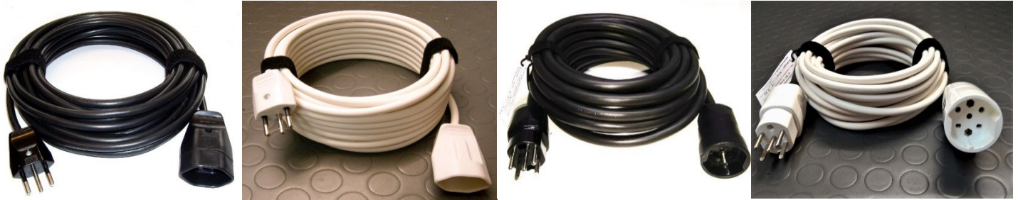
T12/10A/230V/3x1-1.5mm2 Typ 111-1sz = 3x1mm2 Typ 111-2sz = 3x1,5mm2 T12/10A/230V/3x1-1.5mm2 Typ 111-1w = 3x1mm2 Typ 111-2w = 3x1,5mm2 T15/10A/400V/5x1.5mm2 Typ 333sz T15/10A/400V/5x1.5mm2 Typ 333w

Auch mit Twint auf 079 462 49 37 zahlbar, dabei Lieferadresse und Kabeltyp angeben